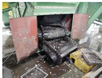
焼損・脱落したベルト

リチウムイオン電池 は、充電して使用できる製品の多くに使われており、強い衝撃や圧力が加わることで発火します。