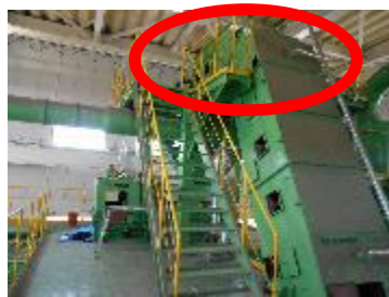
焼損したベルトコンベア

令和5年7月7日、大崎広域リサイクルセンターで火災が発生し、ベルトコンベアの一部が焼損しました。発火当時、不燃ごみを細かく砕く作業をしており、リチウムイオン電池が原因と思われます。