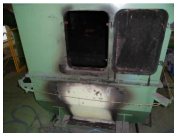
ベルトコンベア上部