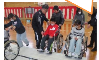
【4日（水）5年 福祉体験学習】

今回の体験より（障害のある方が）どうしてももらったうれしいのか、相手の気持ちになることが大事であることを深く学びました。