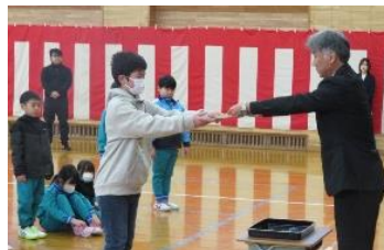
【4日（水）音楽朝会 & 暗唱表彰】

各学年の代表に暗唱パーフェクト賞が送られました。6年生には中学校で取組の形を変え、在校生には次年度も頑張ってもらいたいと思います。