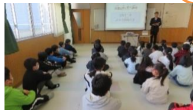
【11日（水）故郷と命を思う朝会】