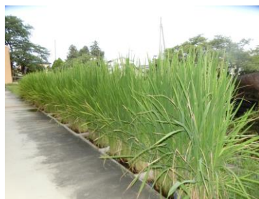
稲もすくすく育っています