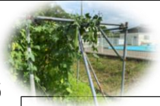
大きく実ったヘチマ