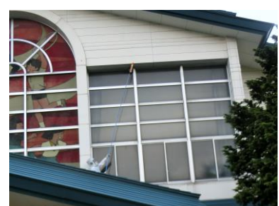
スズメバチの巣の除去の様子