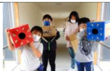
初めてのクラブ活動の日 みんな楽しみに待っていました!