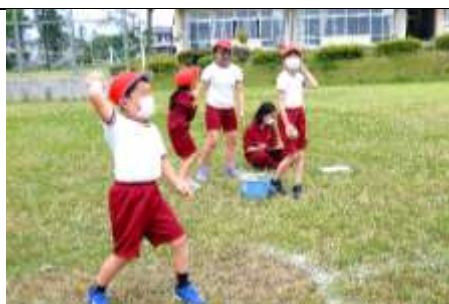
3年ぶりに縦割り班でスポーツテスト