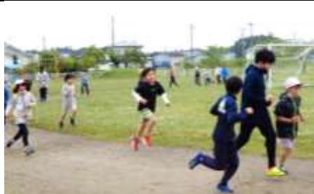
毎週火曜日と木曜日は、全校一緒にフレッシュマラソン! 5分間走ります