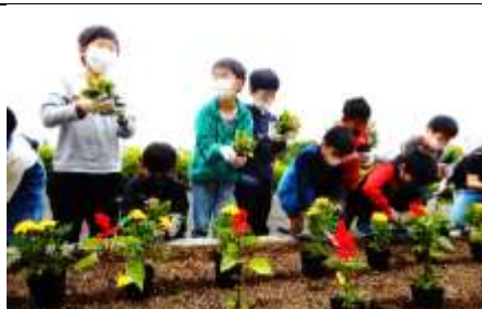
今年も公民館から「花いっぱい運動」のお花をいただき、大切に植えました❁ 美化福祉委員が中心となって、植え方を紙芝居で教えてくれました