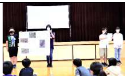
中新田中学校の「虎っこ防犯隊」が 届けてくれた防犯マップを全校に紹介