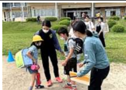
今年度は、校庭での引渡し訓練