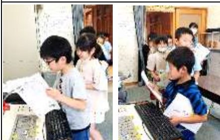
昼の放送を活用して音読や作文を 発表する「ことばのとびら」(2年)