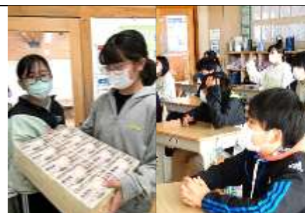
出前授業で税金について学習(6年)