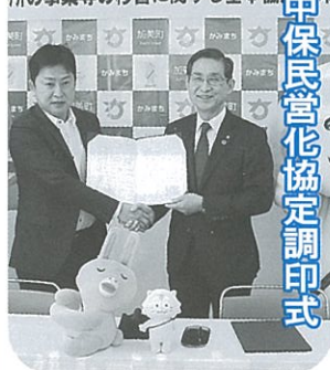
中保民営化協定調印式