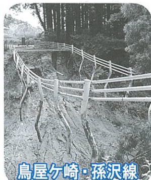
鳥屋ヶ崎・孫沢線