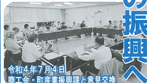
令和4年7月4日 商工会・町産業振興課と意見交換