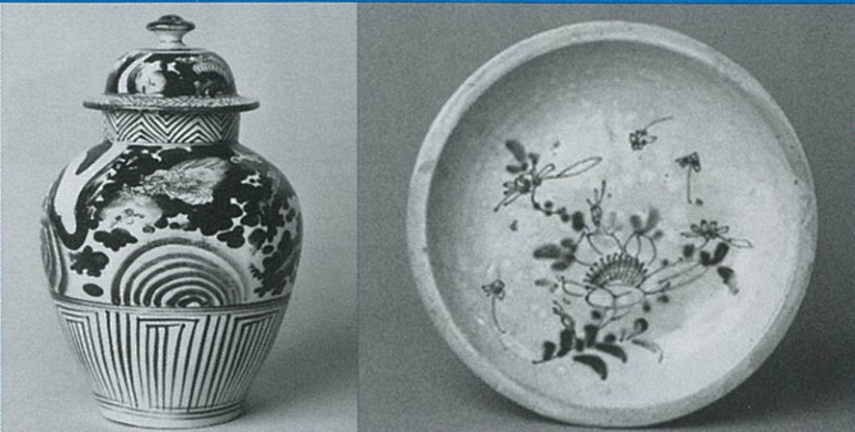
▲1,380点の作品が譲渡される(左:山形県平清水焼 右:福島県大堀相馬焼)