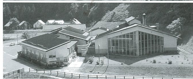
▲振興公社では4施設で7月から東北電力へ切替