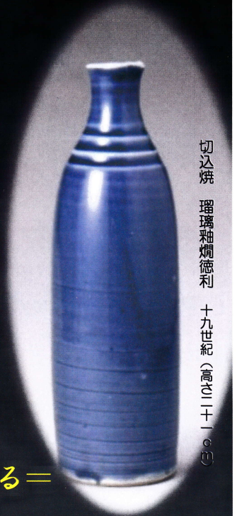
切込焼 瑠璃釉燗徳利 十九世紀(高さ二十一・〇cm)

〇「切込瀬戸山御取行方之文献」(弘化三年)二七・七×二六六cm 〓もうひとつの菅原英伍コレクション〓