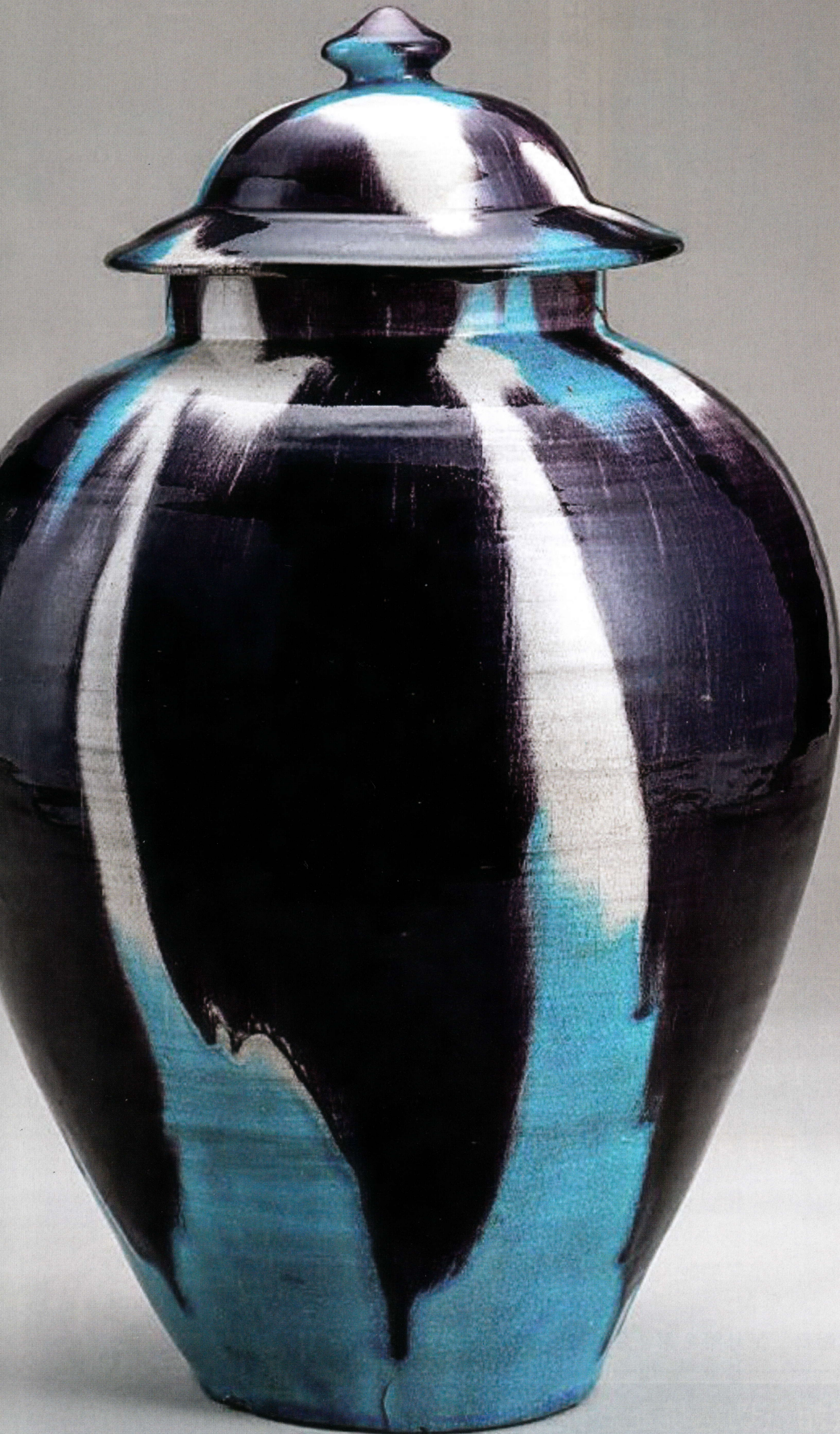
切込焼 三彩蓋付壺 19世紀（高さ43.5cm）菅原英伍コレクション 切込焼記念館

それぞれの関係資料からみえてくる仙台藩士の動き、そして商人達。知られざる切込瀬戸山の意外な舞台裏に迫る。