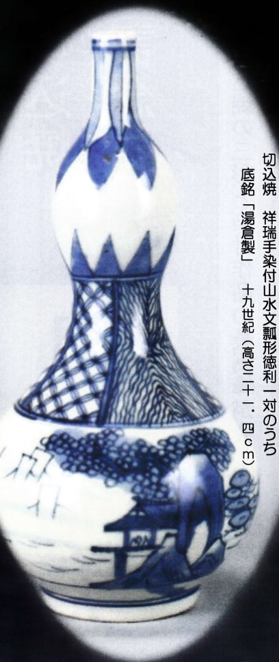
切込焼 祥瑞手染付山水文瓢形徳利一對のうち 底銘「湯倉製」 十九世紀(高さ二十一・四〇cm)