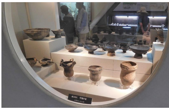
奥松島縄文村歴史資料館