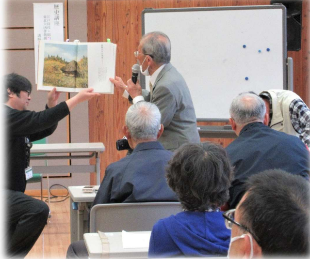
最後まで熱心に説明を続け参加者の理解を深めました。