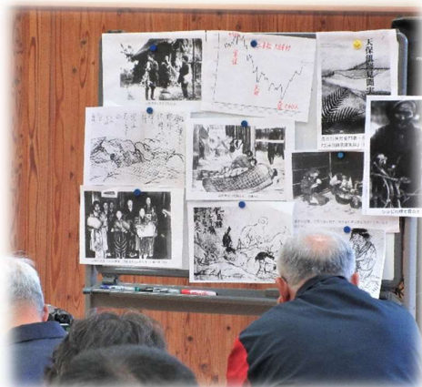
この日のために膨大な文献の中から抜粋した資料の数々。

今回の歴史講座は東北郷土を襲った大飢饉の中、人々がどのように生きたか、当時の新聞記事、見聞を基に東北の惨状と悲しみを後藤先生が解説します。