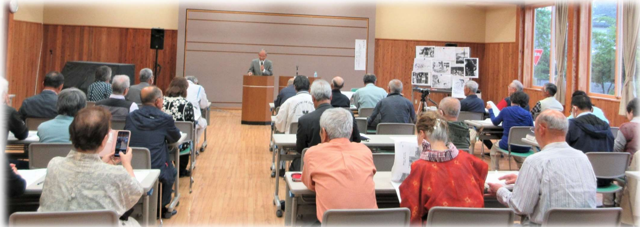
雨の中、多数の参加者が集まり講師の話に熱心に耳を傾けてしました。