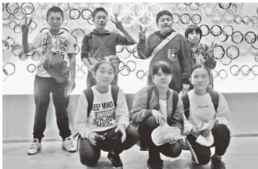
▲オリンピックミュージアムを訪問