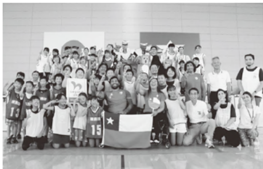
▲パラカヌー選手との交流が優秀作品に!!

昨年9月7日に中新田体育館で行われた、鹿原小学校の児童とチリ共和国パラカヌー選手団との交流をまとめた動画が、「復興ありがとうホストタウン夏休み小学生動画コンテスト」で優秀作品に選ばれ、都内で開催された動画発表会に同小学校の6年生7人が招待されました。 これは、内閣官房オリパラ推進本部が、被災3県のホストタウンの小学生を対象に、ホストタウン交流のPRのため実施したコン