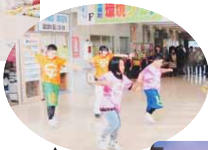
▲ヒップホップダンス