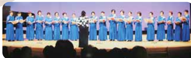
▲懐かしい歌の数々。郷愁あり