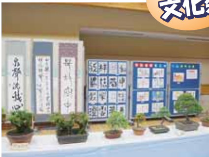
▲「絆」101歳の方の作品です