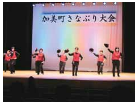
▲都会的なセンスもあります