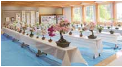
▲花は心のオアシス