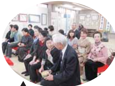
▲いただいた一服にいやされました