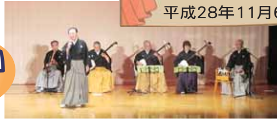
東松島市から 友情出演 津軽三味線です