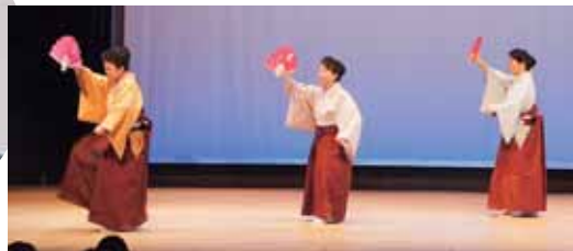
▲息もピッタリ、三人娘