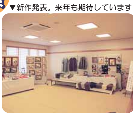
▼新作発表。来年も期待しています