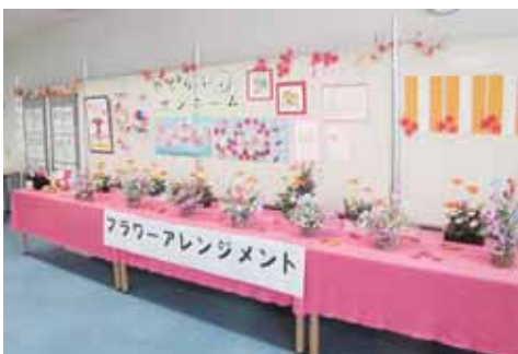
▲サンホームの方々の見事な作品