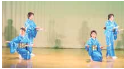
▲しっとりと踊ってくれました