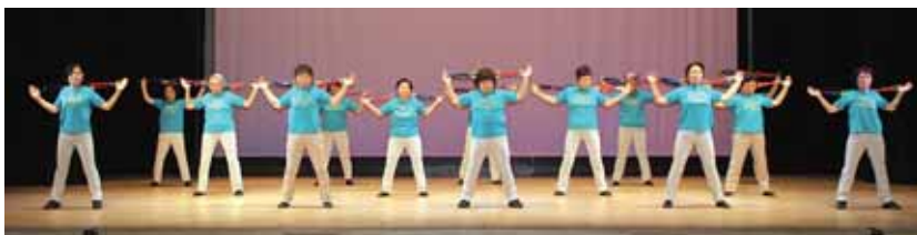
▲う～ん、健康によさそう！！