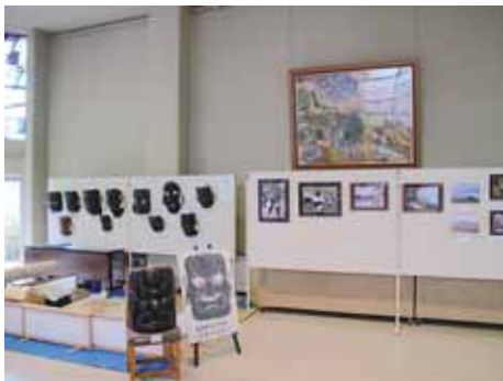
▲バツハホールに初めて展示