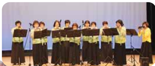
▲ハーモニカに合わせ、口ずさんで……