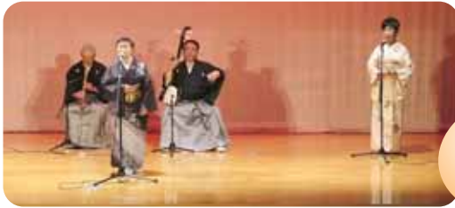
▲聴く方も、歌手も気分最高