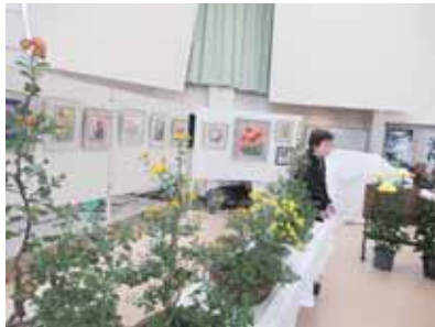
▼ちぎり絵と盆栽の素敵なコラボ