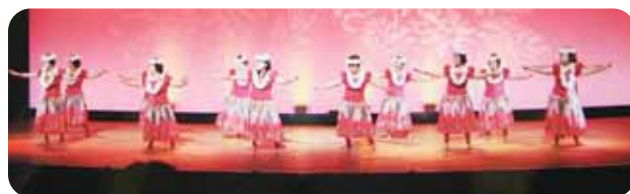
▲南国の情緒豊か！フラガール

おのだ地区文化祭 平成二十八年度の秋まつりは、加美町、農協、商工会、ボランティア、各種団体に文化協会も加わり、やくらい文化センターを一極集中して開催された。大勢の来場者で嬉しい悲鳴であった。 その準備にあたった町の商工観光課、農協、商工関係者の企画力とノウハウに拍手が送られた。それぞれのポジションにあった精一杯努力された関係者に会場の文化協会会員として感謝を申し上げたい。特に一極集中の会場設営に悩みぬいた商工観光課の忍耐に感心のほかない。 展示、農産物展示、健康相談、食の祭典、園芸、チャリティ、夕遊市、抽選会等々単独の文化祭には無い多様な祭典に、多数の来場者に満足感を持ってもらえたことに感謝の念で一杯であった。 (伊藤真夫)