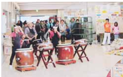
▲開会セレモニーの太鼓