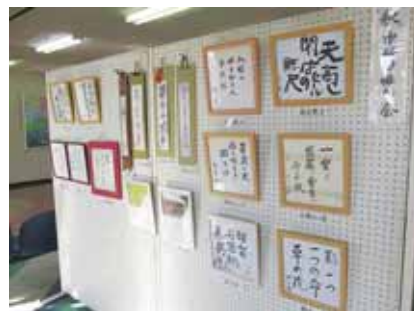
▲どうぞ仲間に入って五・七・五