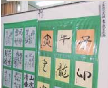
▶十二支を表現して