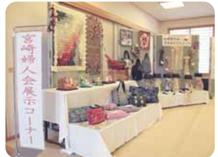
▲素晴らしい！よく作りました