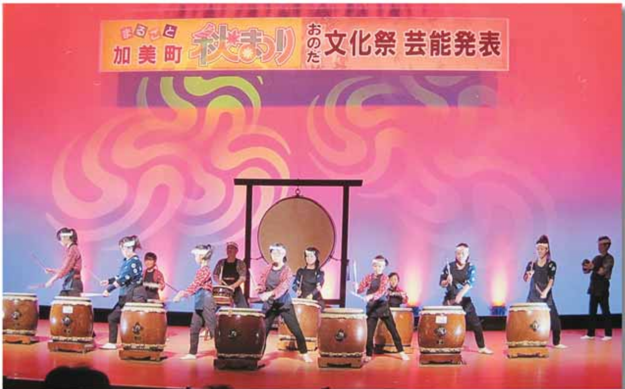
菜鳴太鼓錬心会のバチさばき

今から十五年前に文化芸術振興基本法が公布された。「文化芸術を創造し、享受し、文化的な環境の中に生きる喜びを見出すことは、人々の変わらない願いである。」と前文にある。