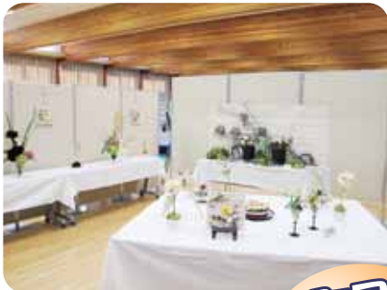
▲見る人を引きつけます