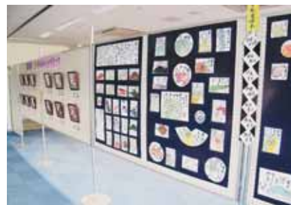
▲絵手紙 心に沁みる