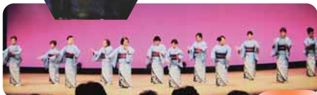
▲甚句と音頭の継承の方々