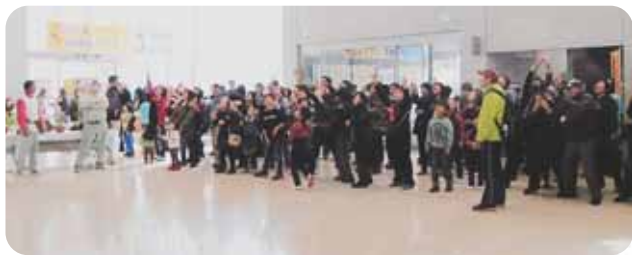
▲この会場の入り、すばらしい