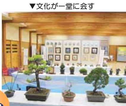
▼文化が一堂に会す