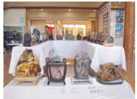
▲よく集めましたね