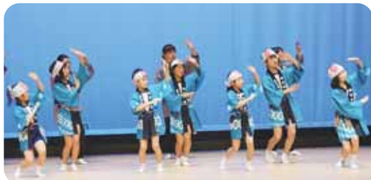
◀子どもたちにも 伝承されて