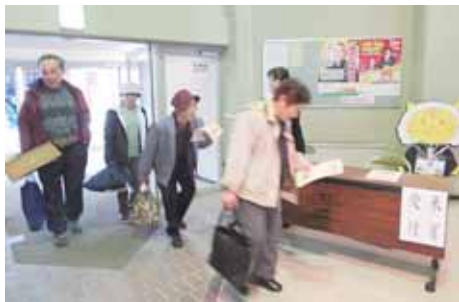
▲天気に恵まれてよかったね