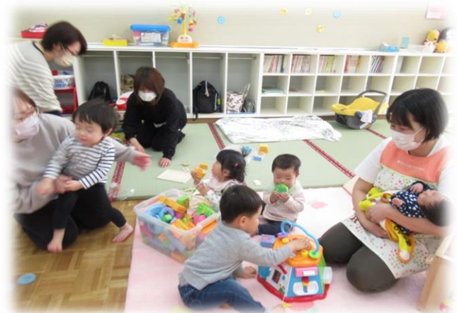
みんなであそぶとたのしいね！！