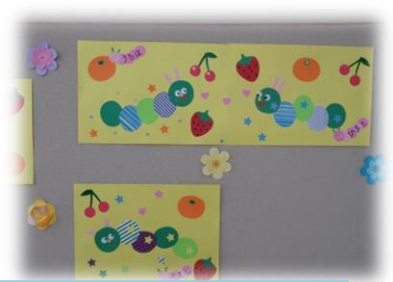
4月の製作はらぺこあおむしくん