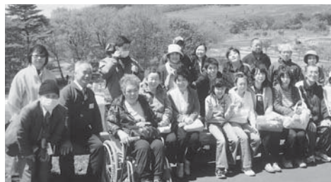
薬菜山をバックに記念撮影