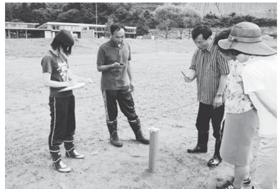
測定機器の数値を確認 (上多田川小学校)

・いずれも健康に影響を与えるレベルではありません。 ・文部科学省が示す屋外活動の制限基準値は、毎時3.8マイクロシーベルト。