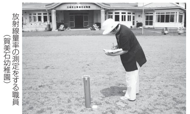
放射線量率の測定をする職員 (賀美石幼稚園)