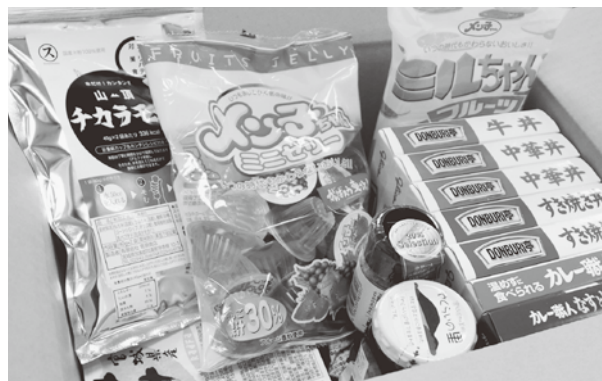
▲レトルトカレーやパックごはんなど、一人暮らしにはうれしい特産品が満載です。

この気持ちを忘れずに、今できることに精一杯取り組みたいと思います。本当にありがとうございました。