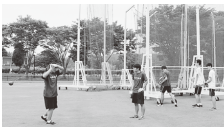
▲投てきフェンスも新しくなり練習に気合いが入る

式典後、中新田高校陸上競技部と宮崎ジュニア陸上クラブが早速試走を行い、新しいトラックを思いっきり駆け抜けました。