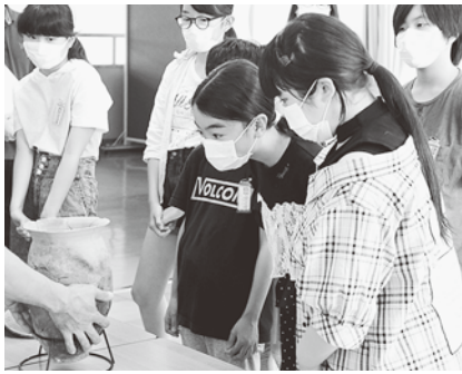
▲縄文土器はどんな色？どんな形？

6月29日、西小野田小学校6年生を対象に、町の遺跡や文化財を学ぶ出前講座を行いました。