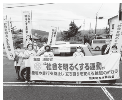
▲地域の力で社会を明るく

犯罪や非行の防止と、立ち直りを決意した人を地域で支え、犯罪などのない社会を築こうとする運動が「社会を明るくする運動」です。 7月は強調月間となっており、町内では保護司などが啓発活動等を行い、運動への理解と協力を呼びかけました。