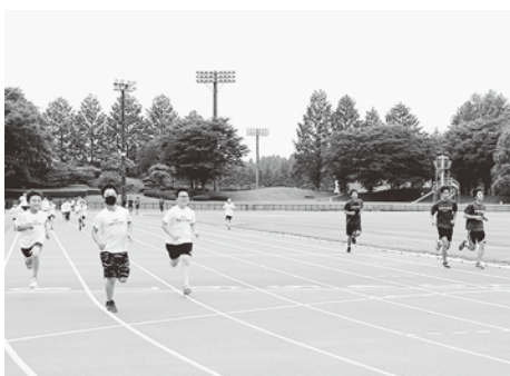
▲新トラックを全力疾走！！

昨年9月から行われていた加美町陶芸の里陸上競技場の大規模改修工事が終了し、6月28日にリニューアルオープンしました。