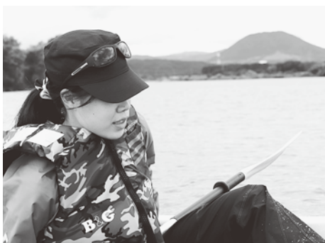
▲初めてのカヌー！いい汗かきました！

観光客も来られませんが、今は私にとっていい準備期間です。まず自分で体験しないと、PRしても気持ちが入ってない、説得力がないと思います。私も、今まで食べたことのないものも色々試しました。町の地図を持って、飲食店やお菓子屋さんなどに行っています。加美町は「外国の方が来ても楽しめる」という自信があります。