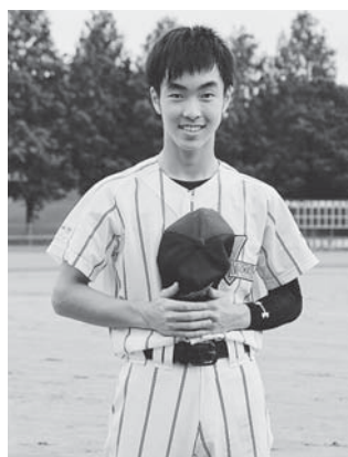
宮崎中学校 野球部

交流会では、たくさんの方に支えていただき楽しくプレーできました。このような状況で、交流会を行えたことに感謝の気持ちでいっぱいです。今まで一緒に活動してきた後輩には、3年生の目標であった「県大会で勝利」という目標を達成してほしいです。今まで支えてくださった方々、応援してくださった方々、ありがとうございました。