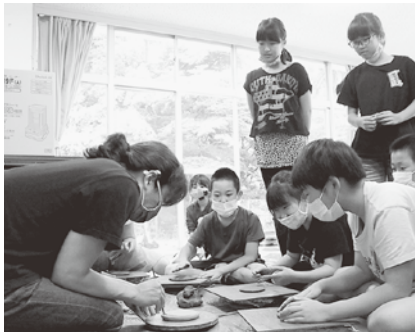
▲プロの技に真剣な眼差し

宮崎小学校では、4年生の総合的な学習の時間に、旭切込地区発祥の「切込焼」について学んでいます。