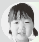
はやさか いちか 早坂 一花ちゃん (あさひ) まいにち はみがきががんばります!