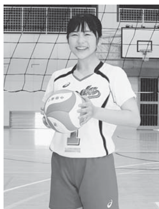
小野田中学校 女子バレー部

僕のように、中総体を目指して頑張ってきた人たちがたくさんいたと思います。郡交流会の開催は、たくさんの支えがあったからこそ実現できたものです。僕たちが、最後に大好きなバスケットを楽しむことができたのも、その方々のおかげです。開催に協力してくださった、すべての方に感謝します。ありがとうございました。