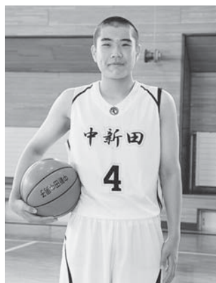
中新田中学校 男子バスケットボール部