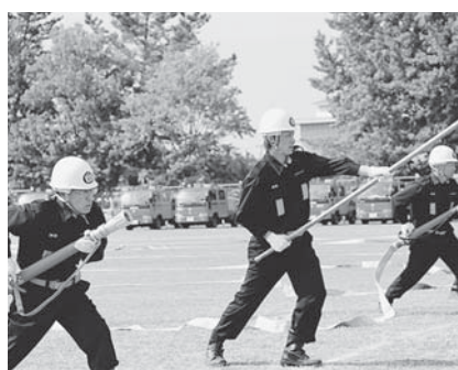
真剣な眼差しでのポンプ操法