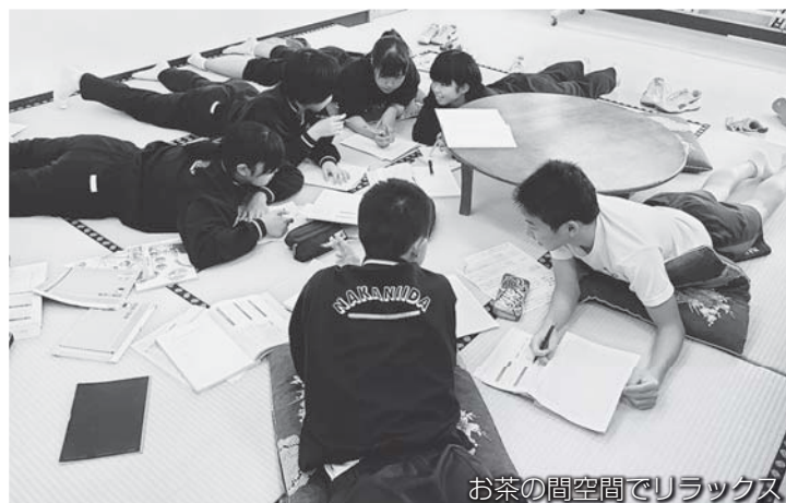
お茶の間空間でリラックス