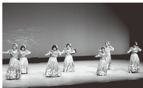
南国気分を感じさせるフラダンス (加美町さなぶり大会)

神彫りの実演や、絵画、書道の展示を行い、それぞれの会場でたくさんの方の来場者の目を楽しませました。