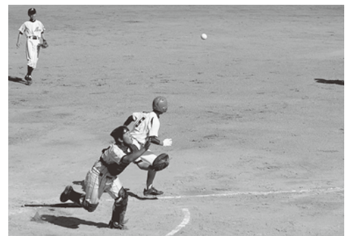
ボールも優勝も掴み取る!!（宮崎中）