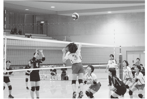
みんなで繋いで必ず決める！（小野田中）