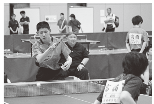
コースを突いて打ち返す（宮崎中）