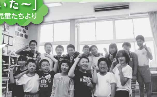
エアコンを前に子どもたちは満面の笑顔