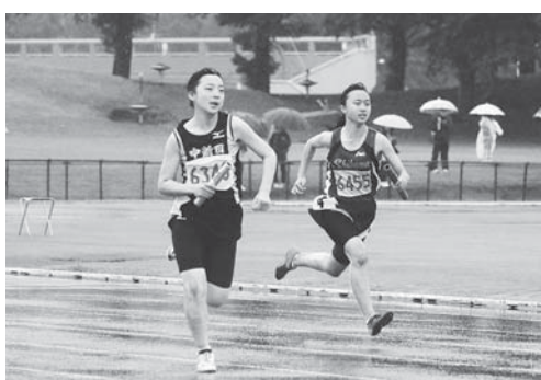
接戦を制し、400mリレーで優勝した中新田中A