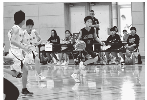
僅差の得点で優勝を勝ち取った（小野田中）