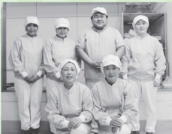
「(株)ニコクトラスト」 中新田小学校調理員の皆さん

子どもたち全員が完食できるよう、栄養士の先生と連携して、「安心・安全」をモットーにおいしい給食づくりに取り組んでいます。たくさん食べて元気に学校生活を過ごしてください。