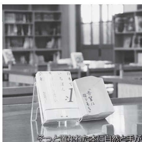
そっと置かれた本に自然と手が

そんな四倉先生の「図書室マジック」で図書室を訪れ、本を手にする生徒は急増中です。