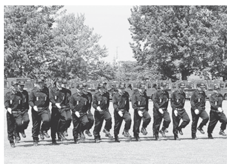
訓練の成果を存分に発揮の部隊訓練

ばっチリ2 チリ国旗の、星は進歩と名誉、白はアンデス山脈の雪、青は澄んだ空と海、赤は独立を表しているんだ〜ご!