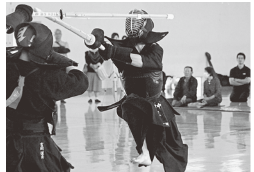
果敢に攻め続け、4連覇達成（中新田中）