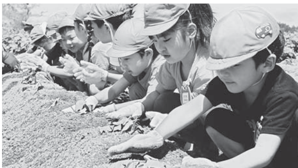
大きくなるようお願いを込める園児たち