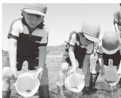
アユさん大きく育ってね

鳴瀬川大橋付近の河川敷では、中新田地区の幼稚園・保育所の子どもたち94人が、稚魚の放流を体験。小さな鮎に「大きく育ってね」と声をかけ、