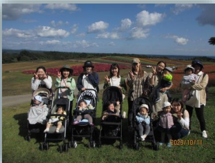
やくらいガーデン散歩！

10月は秋の散歩やりんご狩りなど秋の行事をたくさん楽しみました！天気にも恵まれてみんな楽しそうでした★