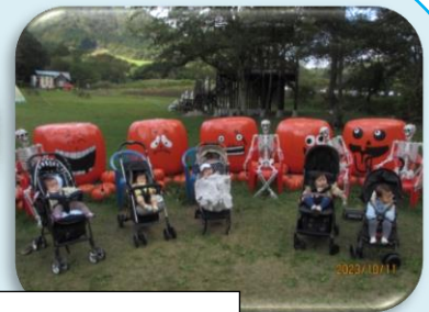
みんなでハイ・チーズ！