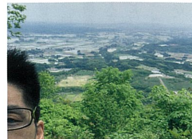
5月の葉菜山頂から

いろんなところに出発しています。やったことのない事なんでもまずはやってみる！何かお手伝いできる事があればお気軽にお声掛けくださいませ♪