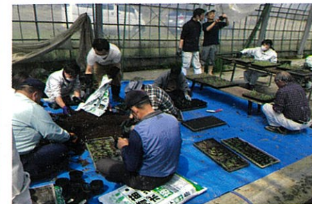
研究会の皆さまと楽しく作業しました