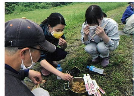
差し入れの初物筍の煮物を食す♪