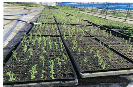
今年もたくさんの芽が出ました