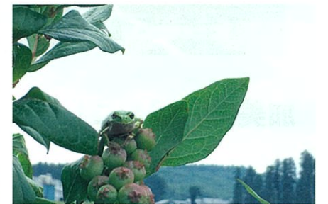
蛙も喜ぶ月崎ブルーベリー♪