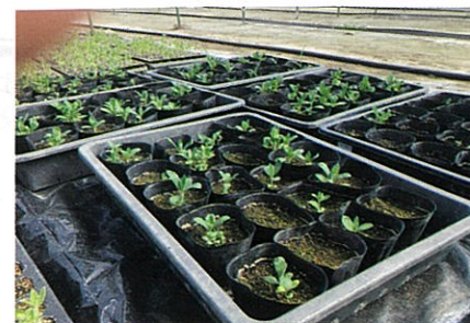
セルトレーからポットへ移植