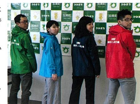
私たちに教えてください！

こちらのコーナーでは、今後、現役隊員やOB・OGの企画イベント、参加するイベント等を紹介します。現在はコロナウイルス感染症の影響により、イベント企画・参加等は自粛しています。今後活動に進展がございましたら随時掲載していく予定です。どうぞお楽しみにしてください！