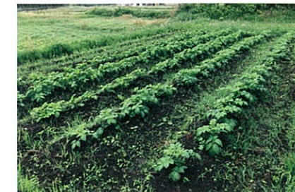
今年は畑にもチャレンジ、収穫が待ち遠しい