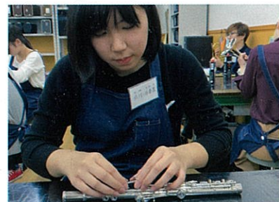
東京校でリペアを学んでいました