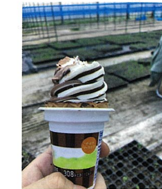
ご褒美のアイスが美味しかった♪

4月27日、ムラサキの移植作業に参加してきました。セルトレーで芽出したムラサキをポットに移植させる作業です。しっかりと根付かせて、畑に定植する準備です。薬用植物研究会の皆さまのご指導の下、一つ一つ丁寧に作業しました。ハウスの中はとても暖かく、作業に集中すればするほど汗がポタポタと、みんなががんばりましたね。午前中で無事作業は終了。ご褒美のアイスが体に染み渡りました♪ 続いて5月24日、ポットに移植したムラサキを畑に定植する作業です。小さいながらもポットの中で立派に紫色の根を張るムラサキに感動を覚えながら畑に植えていきます。これが半年後には大きく育ち、根っこが薬用に使われるのですね。移植作業の時よりもたくさんの方が参加していたので、あつという間に作業は終了。次回の作業もお手伝いに来たいと思います。