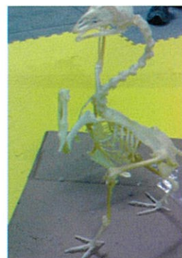
本物の鶏骨の組み立て