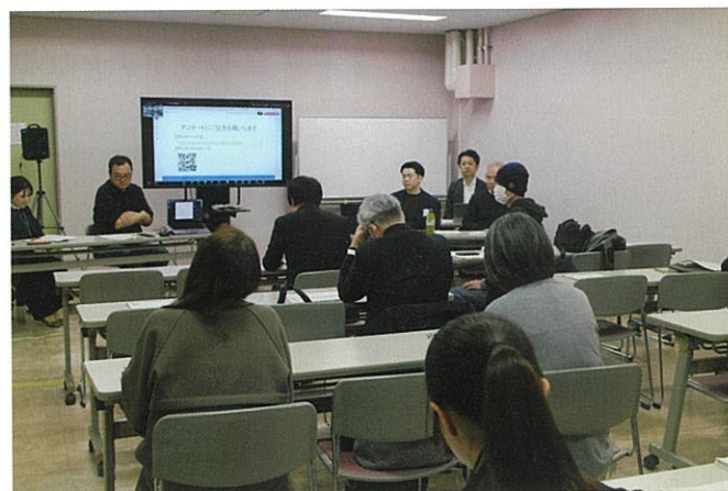
▲プロボノについて真剣に学んだ参加者たち

社会課題が複雑化するなか、プロボノは多様な主体が連携する新たな協働の形として、今後さらなる広がりが期待されます。