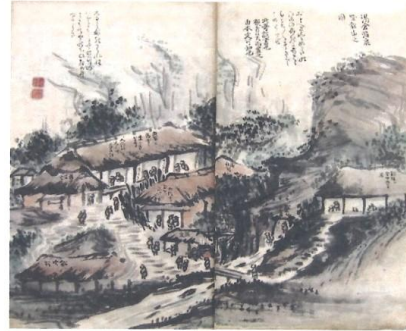
《湯倉温泉と嵐山の図》