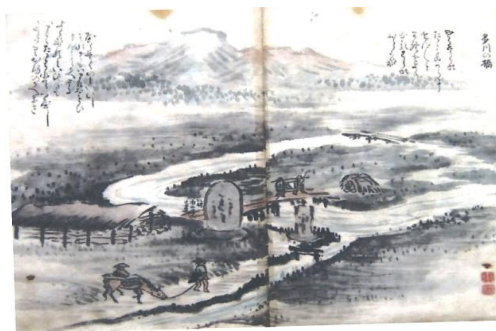
《鳴瀬川と田川が分流 南山寺の湯殿山碑が見える。》