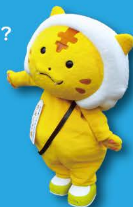
加美町公認キャラクター 「かみ〜こ」