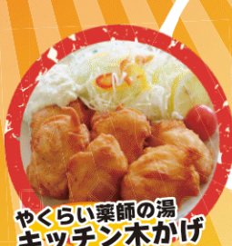
やくらい薬師の湯 キッチン木かげ