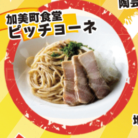
加美町食堂 ピッチョーネ