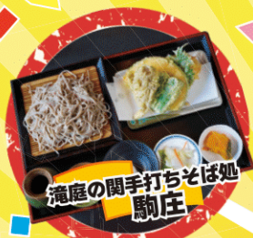
滝庭の関手打ちそば処 駒庄