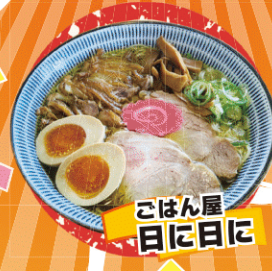
ごはん屋 日に日に