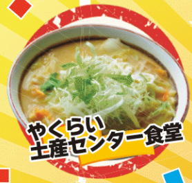
やくらい 土産センター食堂