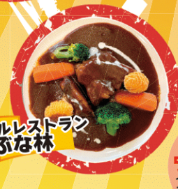
地ビールレストラン ぶな林