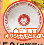
全店制覇賞 オリジナルどんぶり

■お問合せ 加美町観光まちづくり協会 TEL0229(25)7550【月曜定休】