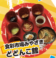
食彩市場みやざき どどんこ館