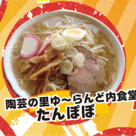
陶芸の里ゆ〜らんど内食堂 たんぼぼ