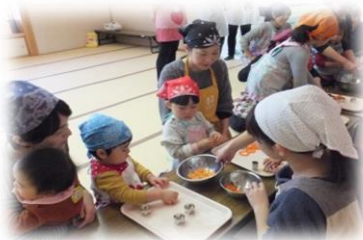
「お手伝いは楽しいな〜!」

各広場・支援センターによって開催日は異なりますが、年に4回ほど開催しております。興味のある方はぜひご参加ください。