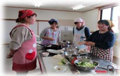
「離乳食作りって大変だよね...」