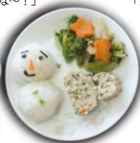
《ご飯が雪だるまに変身!》