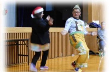
♪とても楽しかったね♪