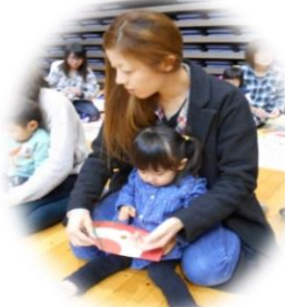
★サンタとトナカイを作ったよ★

ツリーにも飾れるように、シールを貼ってサンタとトナカイを作ったり、ジャイアンとパパのしょうちゃんさんによるふれ愛あそび歌で楽しく体を動かしました。そしてサンタさんが登場すると、子どもも大人も大喜び♪サンタさんは「生まれてきてくれてありがとう!」との思いを込めてプレゼントを渡して頭をなでてくれました。みんな楽しく、幸せな一日になりました♪