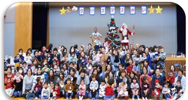
★たくさんのお友だちとハイ・チーズ!★