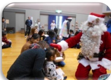
☆サンタさんの手は大きかったよ☆