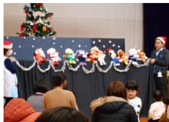
★アンパンマンもきたよ★