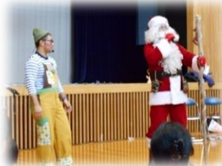
☆しょうちゃんさんとサンタさん☆