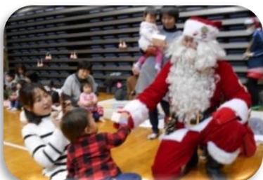
★優しいサンタさん ありがとう★