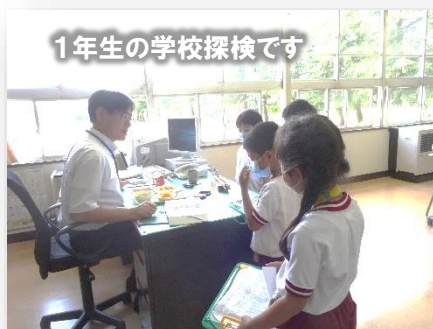
1年生の学校探検です