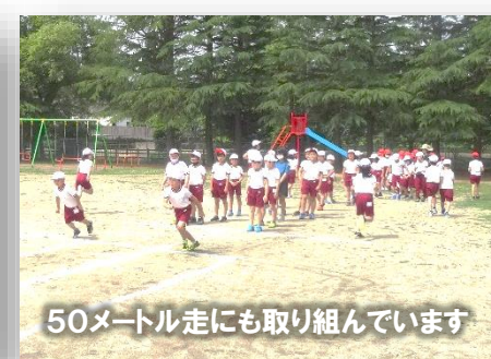
50メートル走にも取り組んでいます