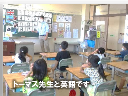
トーマス先生と英語です