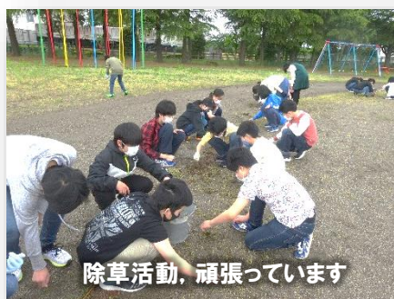
除草活動、頑張っています