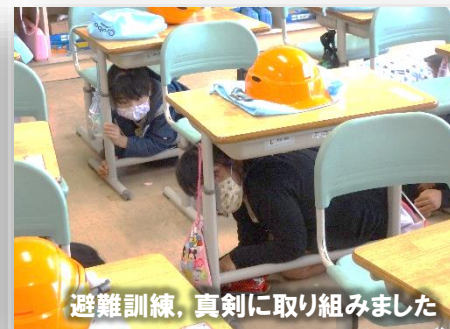
避難訓練、真剣に取り組みました