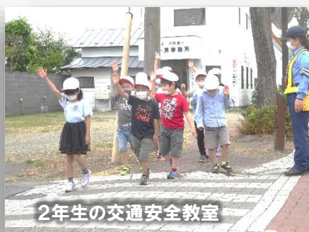
2年生の交通安全教室